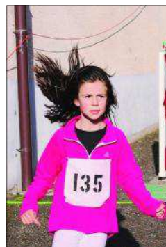
Les écoliers n'ont pas ménagé leurs efforts pour réaliser de belles performances.