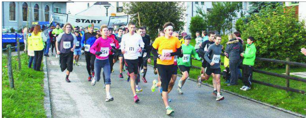
Et c'est parti! A 9h15 précises, le départ de la course était donné.